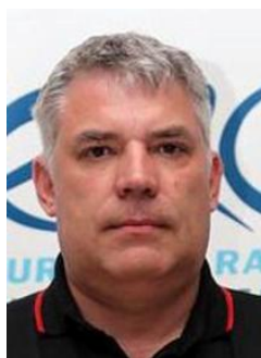
Главный судья (руководитель гонки)