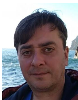
Офицер парка сервиса