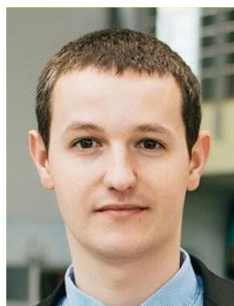
Офицер по связи с участниками