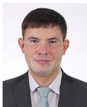
Офицер парка сервиса