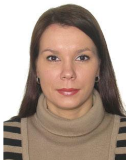
Офицер по связи с участниками