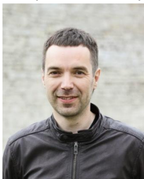
Главный судья (руководитель гонки)