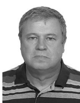
Офицер парка сервиса Тех. контролёр (Ст. судья бригады)