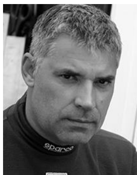
Офицер по связи с участниками